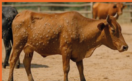
Nódulos repartidos por todo el cuerpo.

Buscar cuidadosamente lesiones de estos tipos: