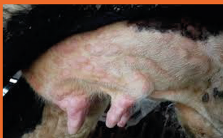
Nódulos en las ubres.