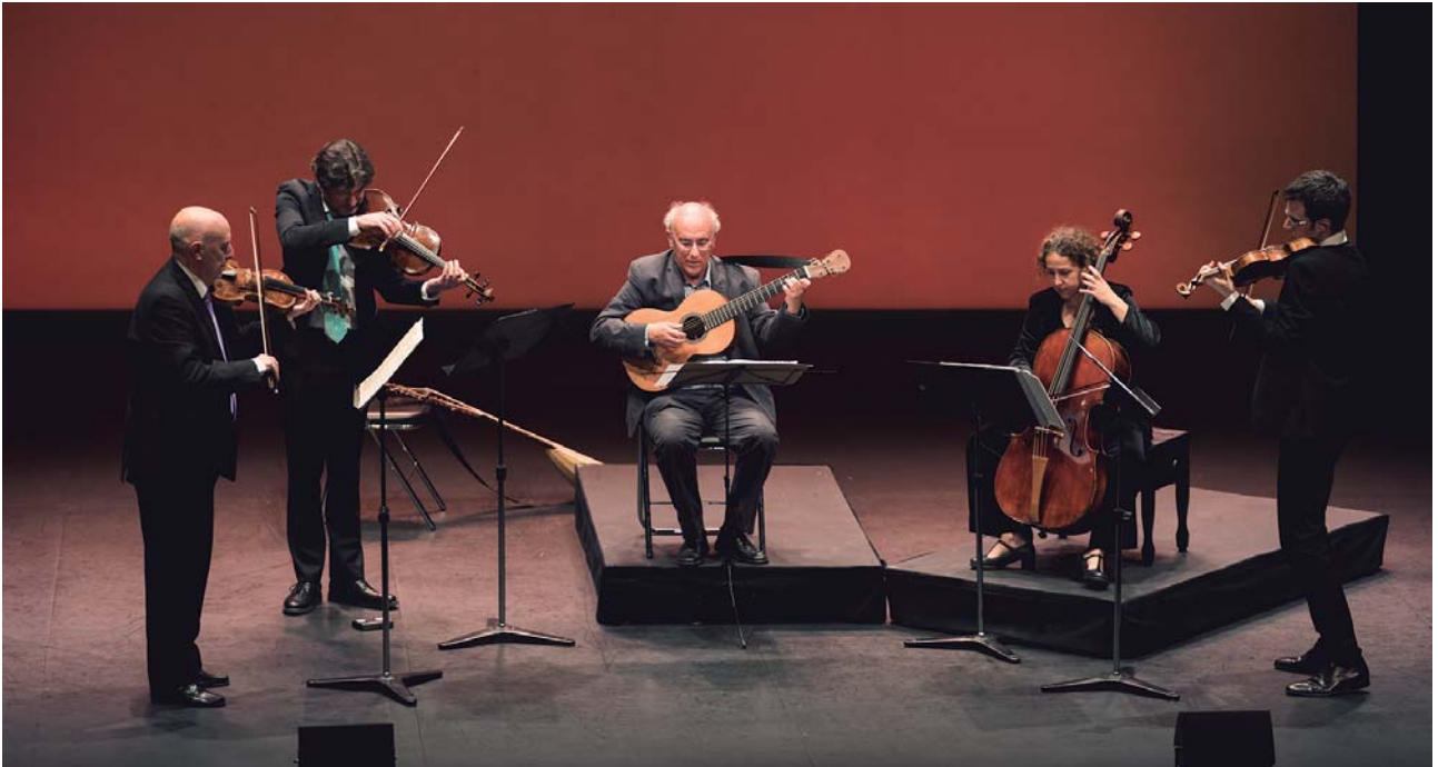
La Real Cámara

ensemble de cámara que pudiera interpretar ese valioso repertorio inédito, contando con un importante grupo de músicos nacionales, todos ellos individualmente reconocidos por su prestigio internacional y su enorme experiencia en la práctica histórica.