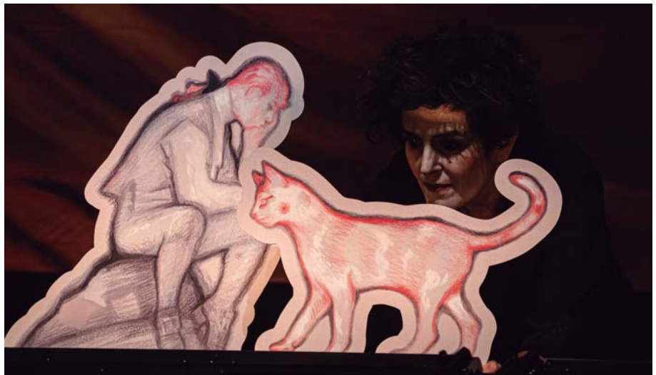
El gato con botas

El Gato con botas o Maese Gato es un cuento popular europeo recopilado en 1695 por Charles Perrault. Cuenta la historia de un gato que gracias a su astucia consigue la fortuna y la mano de una princesa para su amo, totalmente pobre. Desde su publicación, en 1697, en su libro Cuentos de antano , que dedicó y regaló a la sobrina de Luis XIV, tuvo muchísimo éxito.