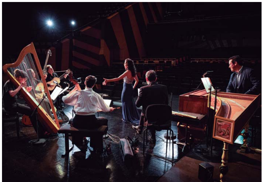
Cappella Mediterránea