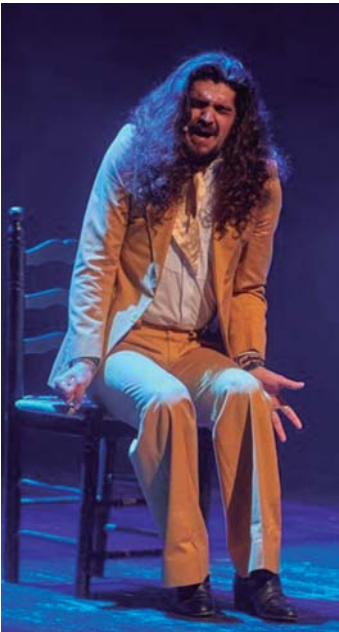
Israel Fernández

C on Ópera Flamenca , Israel Fernández junto a Diego del Morao, pretenden hacer su particular reivindicación y acercarnos un pedacito -musical- de esta época flamenca comprendida entre mediados de los años 20 hasta 1950, esa que para el cantaor toledano supone su mayor fuente de su inspiración. Siguiendo la propia filosofía de esta etapa, Israel se acerca a alguno de sus referentes pasándolos por su acentuatísima personalidad, haciendo valer su capacidad para refrescar lo antiguo sin llegar a perder ese aroma añejo. Diego por su parte es capaz de dotar el acompañamiento al canto de numerosos elementos nuevos, llevándonos ambos a un viaje en el tiempo lleno de colores nuevos por la edad dorada del canto flamenco. Todo ello aderezado por la cuidadísima dirección escénica de Herminia Navas.