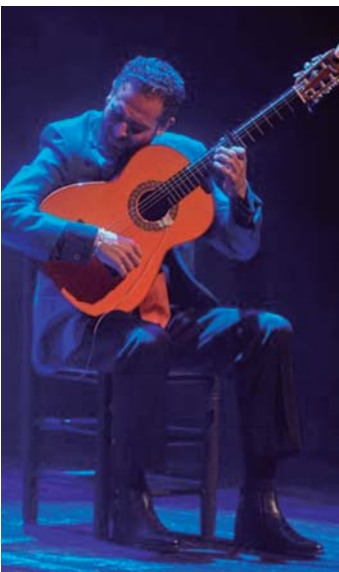
Diego del Morao

Carisma, talento y fresca caracterizan a esta pareja icónica dentro del ámbito flamenco.