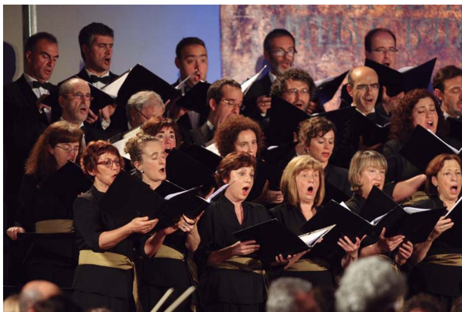
Coral Andra Mari