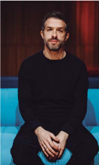
Omer Meir Wellber