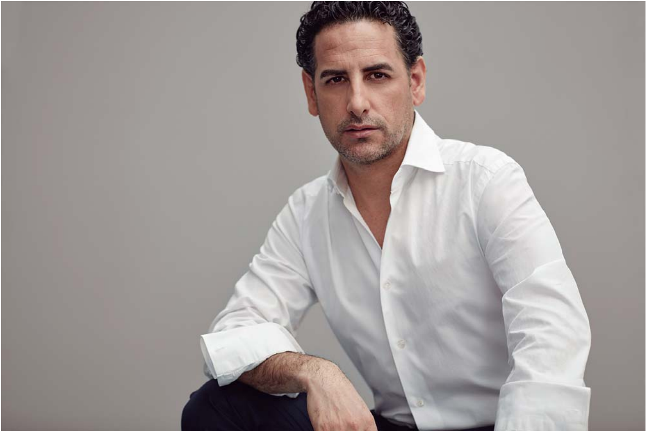
Juan Diego Flórez