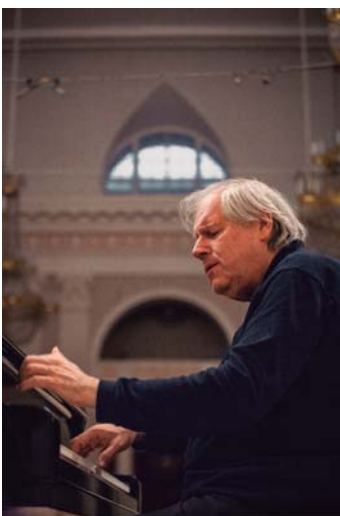
Grigori Sokolov