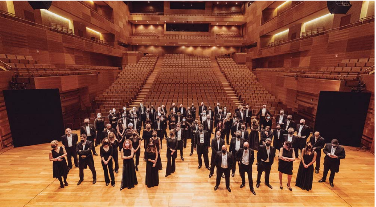
Orquesta Sinfónica de Castilla y León

Performance (PiP), Midori ha presentado conciertos de música de cámara por todo Estados Unidos, centrándose en comunidades más pequeñas que están fuera del radio centros urbanos más grandes y tienen recursos más limitados.