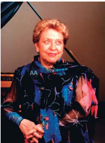
Alicia de Larrocha