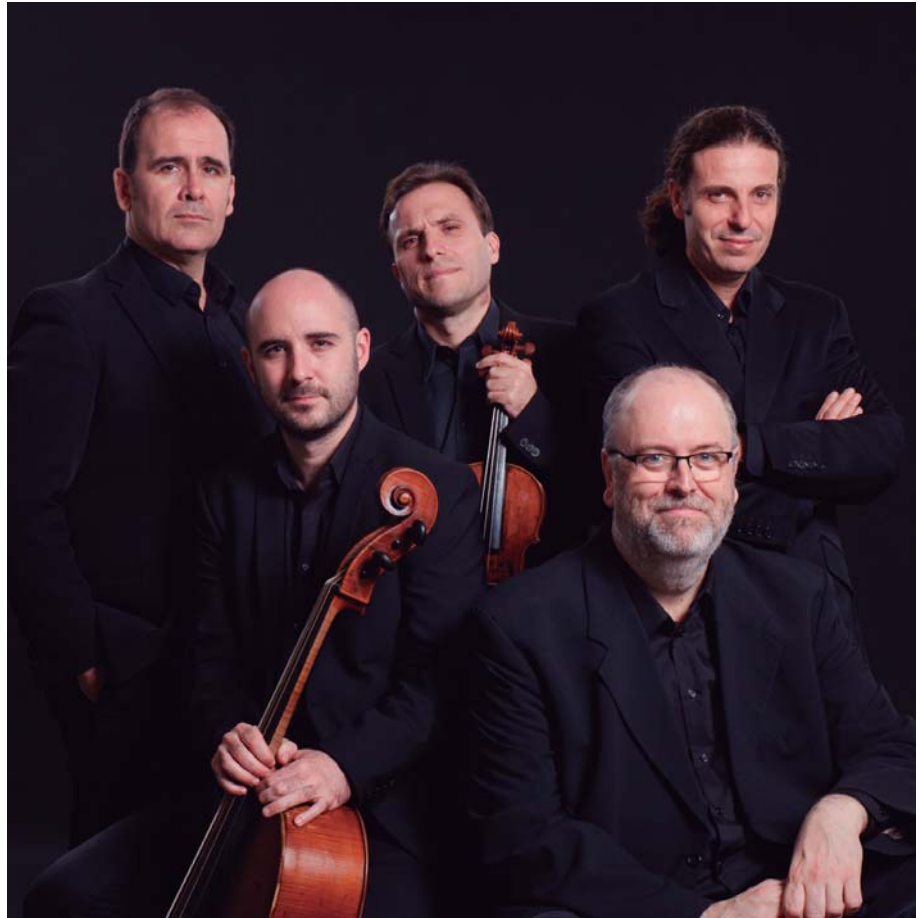
Al Ayre Español