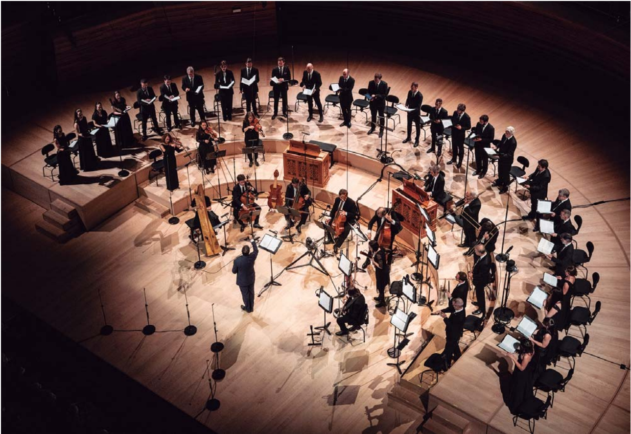
Cappella Mediterránea y Coro de cámara Namur