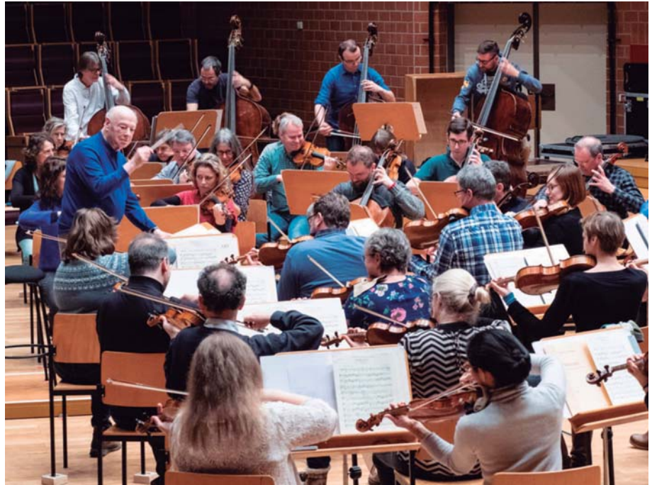
Chamber Orchestra of Europe

Garden, Die Entführung aus dem Serail en la Bayerische Staatsoper, Munich, Die Zauberflöte en el Wiener Festwochen y Wozzeck en el Theatre an der Wien. Estrechamente asociado con el Festival de Aix-en-Provence, ha dirigido nuevas producciones de Così fan tutte , Don Giovanni , La Traviata , Eugene Onegin y Le nozze di Figaro .