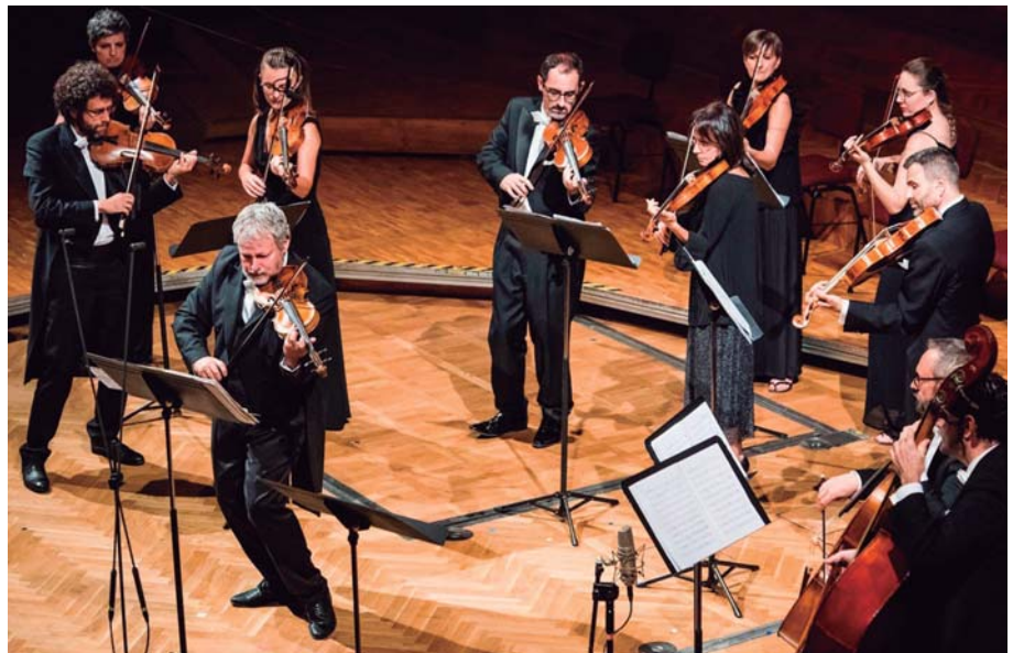
Europa Galante © Fabio Biondi

Ganadora del primer premio del Concurso de Ópera Barroca Cesti 2018 y del Concurso Internacional de Belcanto Vincenzo Bellini 2017, Marie Lys cantó bajo la dirección de Diego Fasolis, Laurence